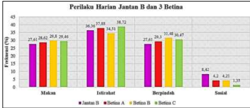
Gambar 3. Frekuensi Perilaku Harian Jantan B dan 3 Betina