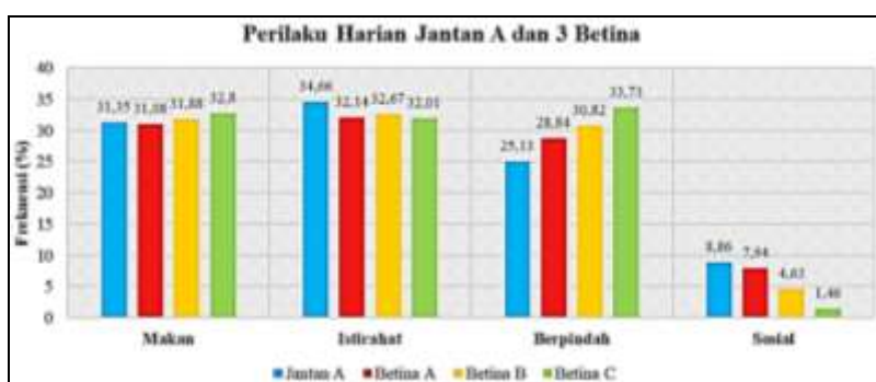
Gambar 2. Frekuensi Perilaku Harian Jantan A dan 3 Betina

Perilaku satwa merupakan suatu tindakan maupun ekspresi pada satwa yang diakibatkan oleh terdapatnya sebuah rangsangan yang memengaruhinya (Pandanwati, 2009). Berdasarkan hasil penelitian 5 individu dewasa rusa total dilaksanakan selama 25 hari pengamatan yakni 14 hari pengamatan pada jantan A : 3 betina, kemudian pengamatan dilanjutkan dengan objek jantan B : 3 betina selama 11 hari setelah jantan A mati pada pengamatan hari ke-16. Jantan A mati akibat terlibat pertarungan dengan jantan B yang juga dalam masa birahi serta menyukai betina yang sama yakni betina A. Berdasarkan hasil penelitian perilaku harian individu dewasa rusa total didominasi oleh aktivitas istirahat dengan rata-rata aktivitas istirahat dari individu dewasa rusa total 36,43%. Keseluruhan frekuensi aktivitas hasil penelitian dari kelima rusa total dapat dilihat pada Gambar 2 dan 3.