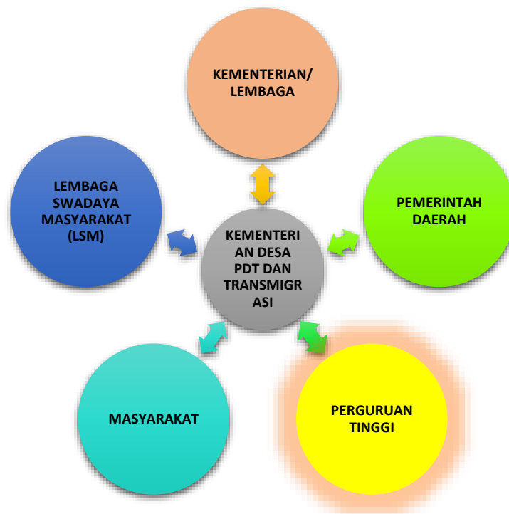
Gambar 1. Koordinasi Kementerian Desa, Pembangunan Daerah Tertinggal, dan Transmigrasi dengan stakeholder

Berdasarkan Peraturan Presiden 12 Tahun 2015 tentang Kementerian Desa, Pembangunan Daerah Tertinggal, dan Transmigrasi, salah satu tugas dan fungsi Kementerian Desa Pembangunan Daerah Tertinggal dan Transmigrasi adalah sebagai koordinator pembangunan desa, daerah tertinggal, dan transmigrasi. Kemendesa PDTT membangun sinergi dengan semua stakeholder termasuk dunia usaha, mitra kerja, media, LSM, serta perguruan tinggi. Koordinasi antara Kementerian Desa, Pembangunan Daerah Tertinggal, dan Transmigrasi dengan stakeholder ditunjukkan pada gambar 1.