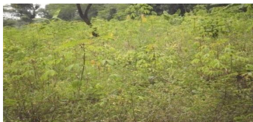
Gambar 6. Kondisi Teras Bangku Pada Hutan Diklat.