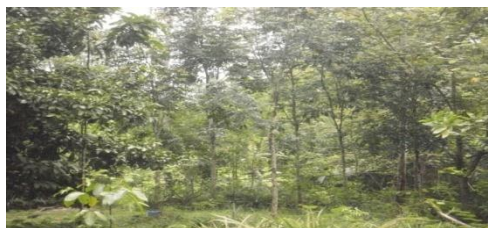
Gambar 7. Hutan Mahoni Pada Hutan Diklat Jampang Tengah