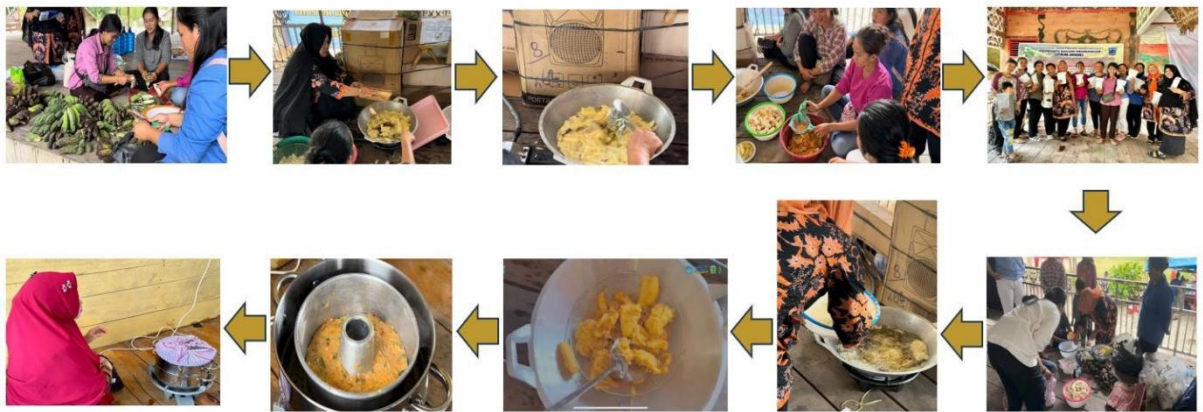
Gambar 2. Proses pembuatan berbagai macam aneka olahan pisang asli Mentawai di Desa Saureinu.