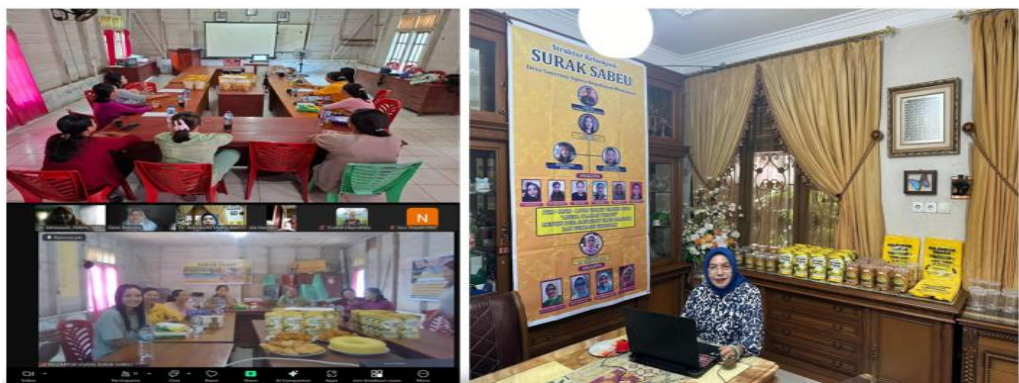
Gambar 5. Monitoring dan Evaluasi Kegiatan PKM-MNM yang dilaksanakan secara Online karena kondisi cuaca yang tidak memungkinkan untuk melakukan kunjungan langsung