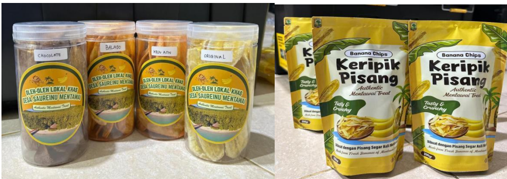
Gambar 8. Kemasan Standing Pouch dan Toples sebagai kemasan dari Keripik Pisang Aneka Rasa.