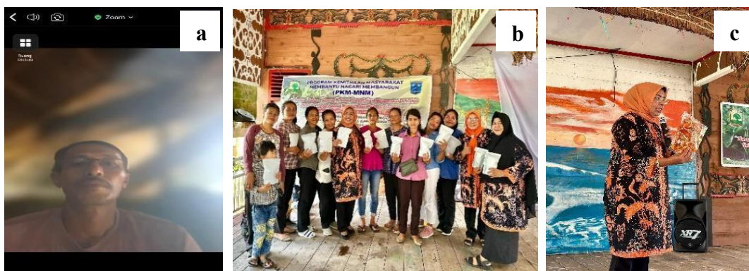
Gambar 1. a. Pertemuan daring tim pengabdian dengan kepala desa sekaligus pembina kelompok ibu-ibu rumah tangga Desa Saureinu; b. Foto bersama tim pengabdian dengan sebagian peserta pada kegiatan sosialisasi dan penyuluhan; c. Ketua tim pengabdian yang sedang memberikan materi penyuluhan tentang Pisang Mentawai.

yang kaya akan vitamin B6, vitamin C, potasium, magnesium, serat, dan karbohidrat.