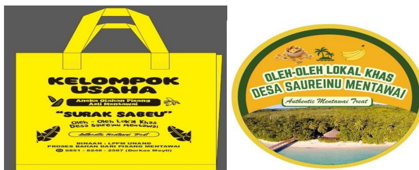
Gambar 9. Desain Tas Spunbond dan Sticker sebagai Branding kemasan dari Produk Aneka Olahan Pisang Kelompok Usaha “Surak Sabeu”.