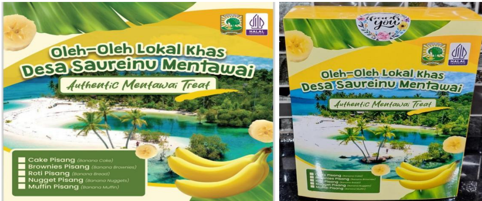
Gambar 6. Desain kotak sebagai kemasan dari Produk Aneka Olahan Pisang Kelompok Usaha “Surak Sabeu”.

layanan, serta menyesuaikan strategi pemasaran dapat dilakukan agar lebih efektif dalam menjangkau audiens yang tepat.