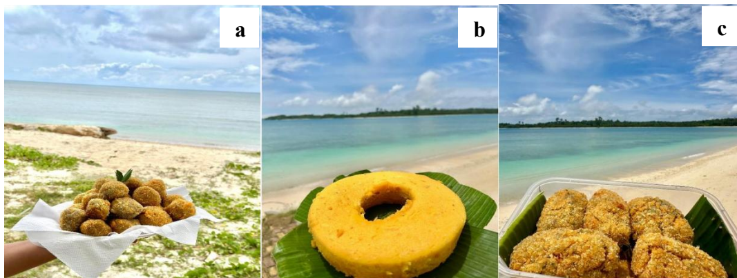
Gambar 4. Beberapa hasil olahan pisang pada kegiatan Pengabdian Kepada Masyarakat Membantu Nagari Membangun (PKM - MNM) di Desa Saureinu; a. Bola-bola pisang isi cokelat dan keju; b. Cake pisang; c. Nugget pisang.