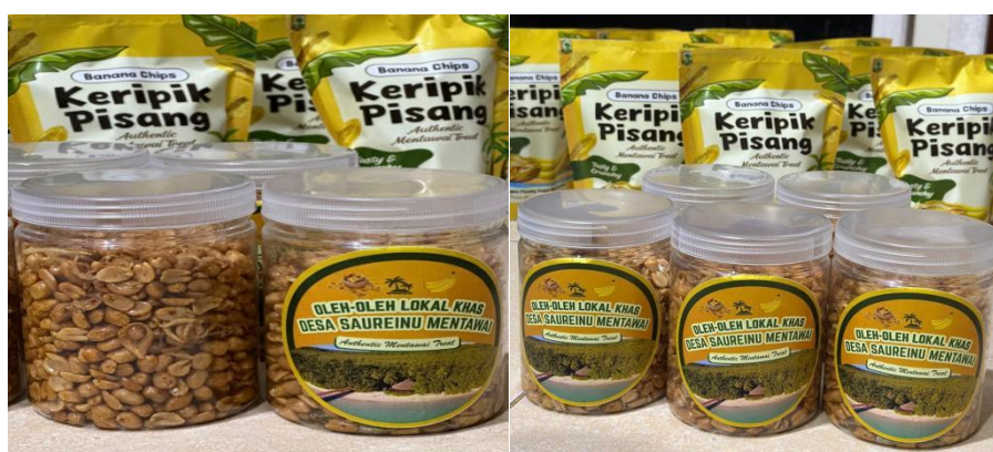
Gambar 10. Rencana produk tambahan kelompok usaha berupa kacang goreng khas Desa Saureinu, Mentawai.