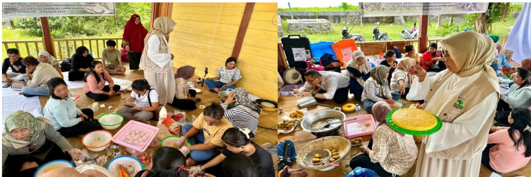
Gambar 3. Proses pendampingan masyarakat oleh tim pengabdian mengenai cara membuat aneka olahan pisang di Desa Saureinu.