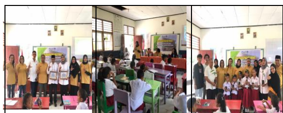
Gambar 2. Mengedukasi Siswa SD Mengenai Kemanfaatan Vegetasi Pohon