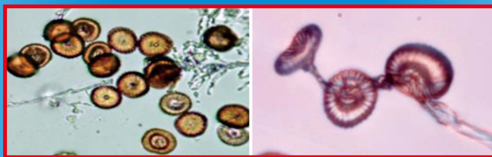
Teliospora Fungi Patogen Karat Tumor