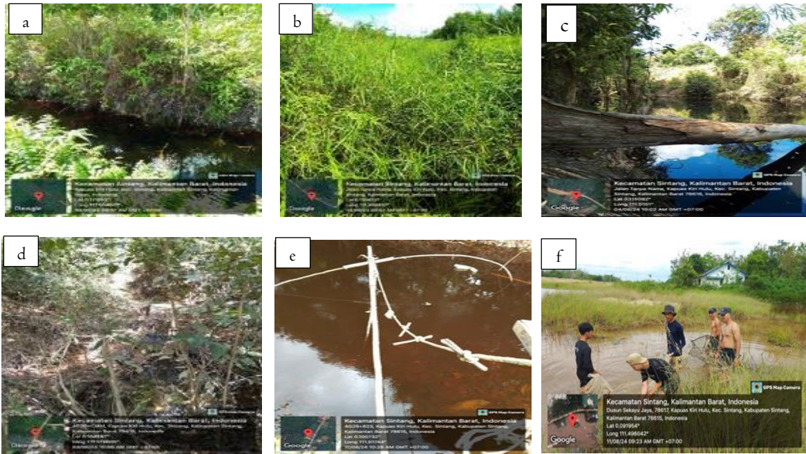
Gambar 2. Lokasi titik pengamatan Iktiofauna

Pengambilan data menggunakan teknik purposive sampling dengan pertimbangan keterwakilan wilayah seperti lokasi yang diduga ada iktiofaunanya. Teknik pengambilan sampel dengan cara langsung ( sweeping ) menggunakan jala, pancing ( pole and line ). Cara tidak langsung ( trapping ) juga dilakukan menggunakan alat tangkap berupa pukat, bubu dan kelambu ikan. Penggunaan alat tangkap disesuaikan dengan karakteristik lokasi yang sudah ditentukan sebelumnya. Peletakan bubu dilakukan berdasarkan hasil survei, yaitu pada tempat-tempat yang diduga banyak terdapat iktiofauna dengan kedalaman \pm 60 cm atau menyesuaikan kondisi di lapangan. Pemancingan terpasang dan bergerak dilakukan pada titik pilihan begitu juga dengan pemasangan pukat. Pemasangan kelambu ikan dilakukan dengan cara terlebih dahulu membersihkan lahan dari rumput/semak. Selanjutnya, kelambu ikan didiadakan/dimasukan ke dalam air pada tempat yang telah disiapkan dan diberi umpan, dan diangkat setiap 1-5 menit atau menyesuaikan kondisi di lapangan. Penebaran jala dilakukan di parit-parit yang memungkinkan pada kawasan rawa gambut. Iktiofauna yang diperoleh kemudian dicatat dan dilakukan pengamatan terhadap morfologinya seperti warna sisik, sirip dorsal, sirip caudal, dan sirip anal.