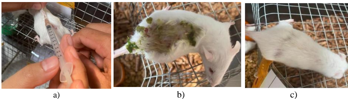
Gambar 4. a) mencit yang diberi perlakuan dengan ivermectin (kontrol positif); b) mencit yang diberikan perlakuan air talas; c) mencit yang sudah mulai sembuh

Evaluasi profil darah sangat penting dalam penilaian klinis hewan. Darah merupakan sistem transportasi utama tubuh. Zat masuk dan keluar dari hampir semua proses metabolisme tubuh dan semua penyimpangan normal yang disebabkan oleh invasi tubuh oleh patogen, cedera, kekurangan atau stres, umumnya tercermin dari perubahan gambaran darah (IEzema et al., 2018). Parameter hematologi digunakan sebagai biomarker dalam diagnosis cedera organ atau jaringan infeksi, parasitosis dan patologi lainnya (Silva-Santana et al., 2020)