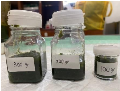
Gambar 3. Ekstrak Talas dalam 100 mL air

Hasil identifikasi dan determinasi dari “Herbarium Bogoriense” Bidang Botani Pusat Penelitian Biologi-LIPI Bogor, terhadap talas yang digunakan merupakan talas liar, jenis talas ( Colocasia esculenta (L.) Schott) Kultivar Hideung, dari suku Araceae. Talas liar merupakan talas yang tidak dikonsumsi, tumbuh liar di sekitar selokan dan di pekarangan. Hasil skrining fitokimia ekstrak ethanol 96 % pada Colocasia esculenta (L.) Schott Cultivar Hideung positif mengandung alkaloid, flavonoid, saponin, tannin dan kalsium oksalat (Widhyastini et al., 2020)