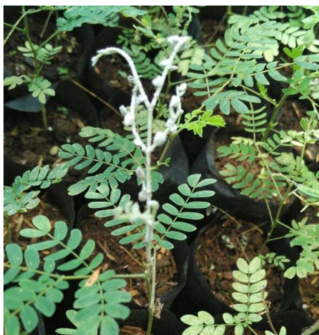
Gambar 2. Gejala Serangan Penyakit Embun Tepung pada Bibit Sengon Berupa Lapisan Putih.

Daun muda yang terinfeksi pada stadia awal pertumbuhannya sangat terganggu dan bentuknya menjadi tidak normal (malformasi) yaitu daun mengkerut, keriting/bergelombang dan mengeras (Gambar 2), akhirnya daun kering dan rontok. Pengaruh infeksi jauh lebih parah pada daun muda dibandingkan dengan daun tua, bagian pucuk daun mengalami kematian ( die-back ). Daun tua yang terinfeksi tidak memperlihatkan perubahan kecuali makin menebalnya lapisan putih pada permukaan daun.