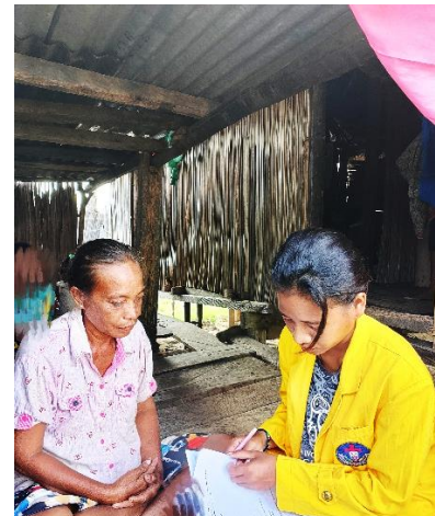
Gambar 2. Proses wawancara dan observasi

Kedua, dilakukan wawancara terstruktur kepada responden dengan menggunakan panduan pertanyaan untuk menggali informasi mengenai karakteristik sosial-demografis (usia, jenis kelamin, pendidikan, pekerjaan, dan lama tinggal) serta persepsi mereka terhadap kondisi sungai dan upaya pengelolaannya.