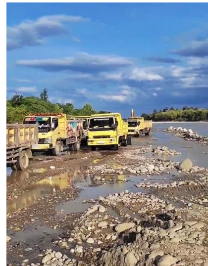
Gambar 3. Observasi dan pengukuran debit Sungai