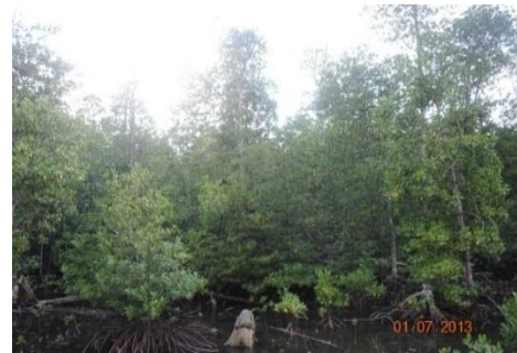
Gambar 7. Kondisi Mangrove di Selat Nasik.

ini tidak merusak secara berlebihan yang menghilangkan ekosistem mangrove. Faktor kuatnya gelombang dan angin juga menyebabkan beberapa tegakan pohon tumbang sehingga mengurangi keanekaragaman jenis.