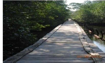
Gambar 8 .Steplan Mangrove di Selat Nasik

seperti Steplan Mangrove yang terdapat di lokasi tersebut (Gambar 8) dan sebagian lagi untuk kawasan konservasi. Sebagian dari wilayah yang ada banyak dimanfaatkan untuk pemukiman penduduk. (Anonymous 2008).