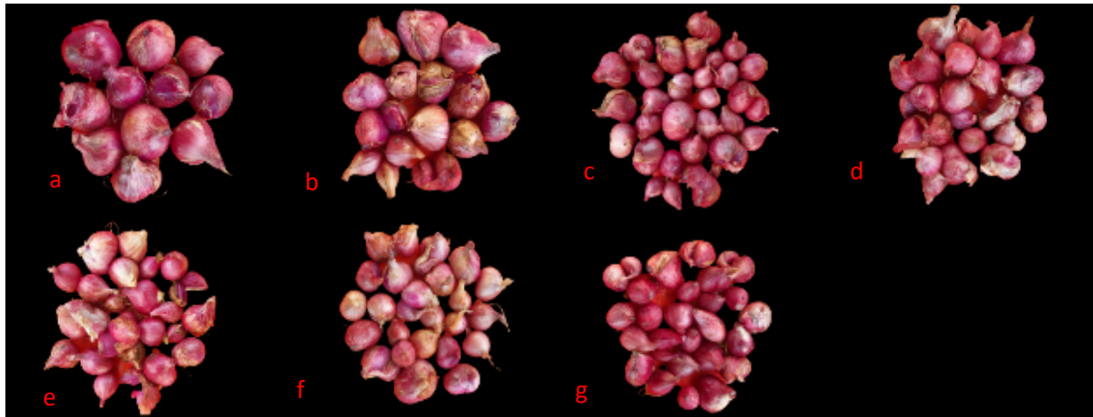
Gambar 2. Keragaan Umbi Tujuh Varietas Bawang Merah. a) Lokana, b) Sanren F1, c) Kramat 1, d) Violetta 2 Agrihorti, e) Mentas, f) Ambassador 3 Agrihorti, g) Rubaru

antara 2,29 – 2,95 cm, diameter aritmetik antara 2,29 – 2,96 cm. Tujuh varietas bawang merah yang diteliti memiliki indeks bentuk dengan nilai kurang dari 1,5 yang mengindikasikan bahwa bentuknya tergolong spherical . Varietas Lokana memiliki karakter fisik yang lebih besar dibandingkan varietas lainnya.